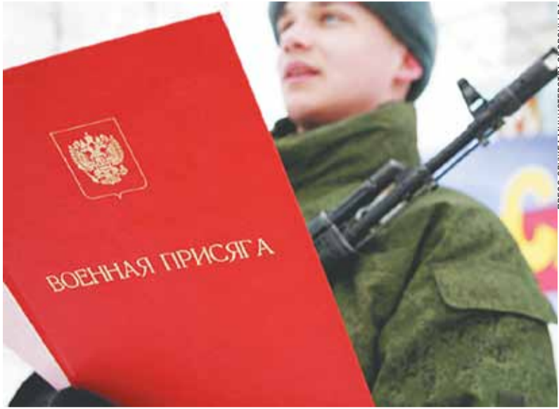
ПРЕСС-СЛУЖБА МИНИСТЕРСТВА ОБОРОНЫ РФ