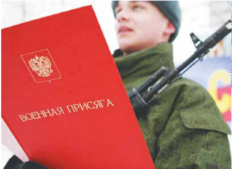
ПРЕСС-СЛУЖБА МИНИСТЕРСТВА ОБОРОНЫ РФ